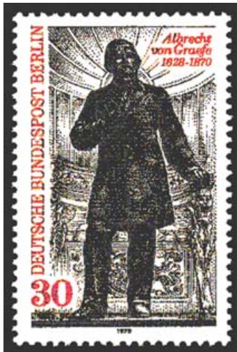
Fig. 2. Sello postal 1978.

del cristalino, microftalmos con coloboma, cuerpos extraños intraoculares, opacidades del vítreo en la iridociclitis aguda, retinosis pigmentaria, desprendimientos de retina, retinoblastomas, melanomas, granulomas coroideos, coroidopatía traumática, oftalmía simpática, oclusión de la arteria central de retina, oclusión de la vena central de retina, atrofia del nervio óptico, papiledema, atrofia óptica post edema, excavación glaucomatosa de papila, neuritis óptica y papilitis (7-9).