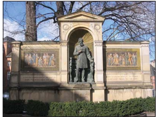
Fig. 3. Monumento en el hospital la Charité, Berlín.

Se relata, como antecedente, que su joven esposa Ana padeció espasmo hemifacial y neuralgia del trigémino.